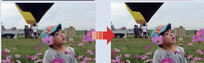
※写真はイメージです。5メガは縦横比の関係上、左右方向へ広がります。