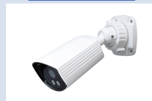
※設置時には被写体から 1m 以上、カメラを離してください