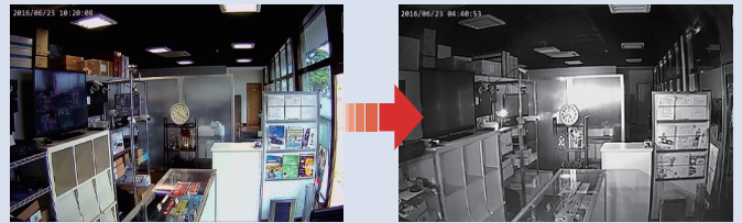
※照明が無い場所を、白黒動画で暗視撮影を行います