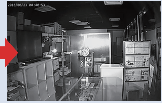
※照明が無い場所を、白黒動画で暗視撮影を行います