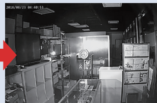
※照明が無い場所を、白黒動画で暗視撮影を行います